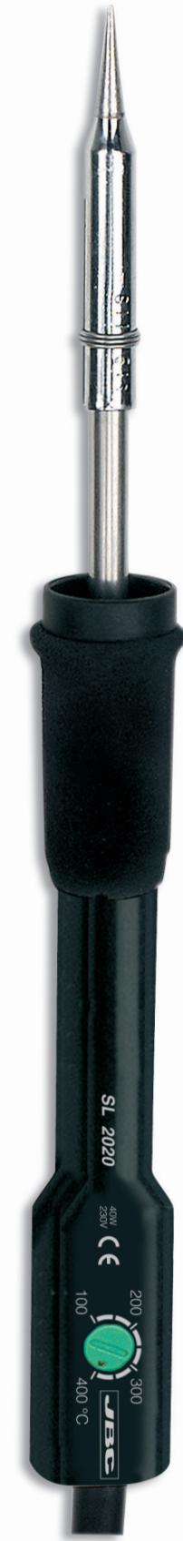
SL2020 TEMPERATURE CONTROLLED IRON