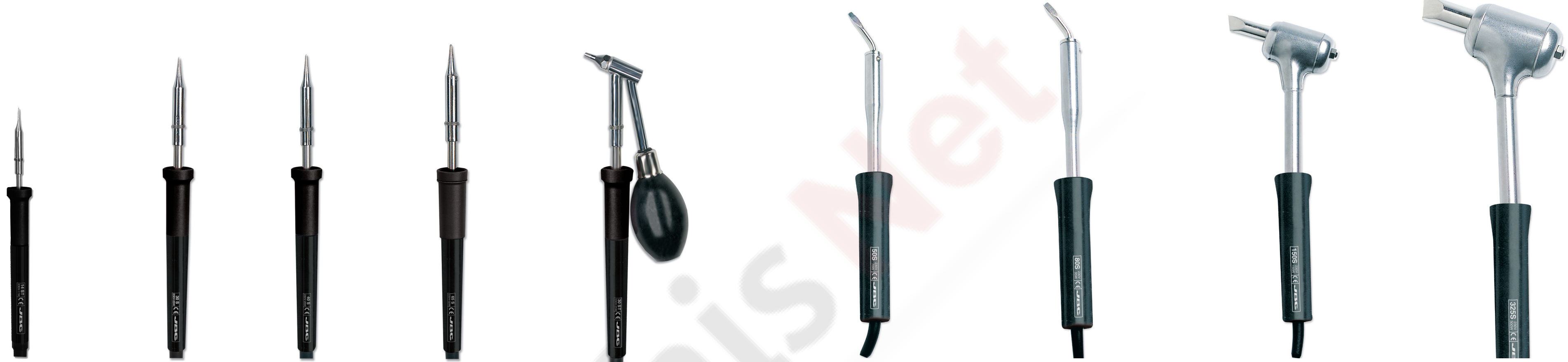
SENIOR LINE SOLDERING IRONS

PENCIL IRONS SOLDADORES LAPIZ FERS CRAYON STIFT-LÖTKOLBEN SALDATORI STILO