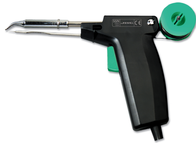
55N PULSMATIC SOLDER FEED IRON